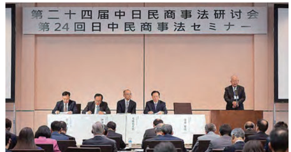
Hội thảo luật dân sự và thương mại Nhật-Trung Tổ chức tháng 11 năm 2019 (Tokyo)

Hội thảo này được tổ chức hàng năm luân phiên tại Nhật Bản và Trung Quốc nhằm mục đích tăng cường hiểu nhau hơn nữa về lĩnh vực luật dân sự và thương mại với Trung Quốc, một nước đang tích cực thúc đẩy phát triển cơ chế kinh tế thị trường. Hội thảo này là cơ hội để nhận những thông tin từ các chuyên gia Trung Quốc về những động thái mới nhất liên quan đến việc cải cách hệ thống pháp luật Trung Quốc, đồng thời tạo cơ hội cho phía Trung Quốc hiểu thêm về hệ thống pháp luật của Nhật Bản.