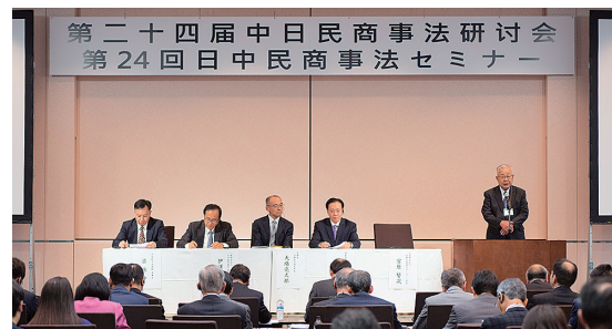
Семинар по японско-китайскому гражданскому и торговому праву Семинар состоялся в ноябре 2019 г. (Токио)

Первый в Японии проект оказания помощи в подготовке законодательной базы был разработан для Вьетнама, его реализация началась в 1996 году. С тех пор проекты в этом направлении продолжают в течение более 20 лет. «Проект по оказанию помощи в проведении к 2020 году реформы законодательства и юстиции» был завершен в конце декабря 2020 года. С января 2021 года был запущен «Проект повышения качества и эффективности правового развития и правоприменения» на период по декабрь 2025 года.