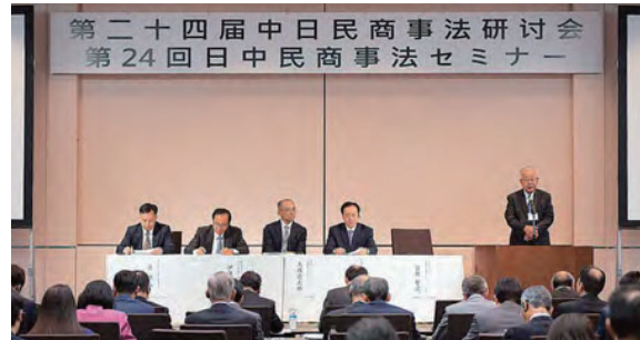
Семинар по японско-китайскому гражданскому и торговому праву Семинар состоялся в ноябре 2019 г. (Токио)

Ежегодно мы проводим с Китаем, идущим по пути развития системы рыночной экономики, совместные японско-китайские семинары по гражданскому и торговому праву с целью углубить взаимопонимание в этой области. Это шанс для нас получить из уст китайских специалистов актуальную информацию о том, как на данном этапе проходит реформа китайского законодательства, а также возможность донести до китайских коллег суть японской правовой системы.