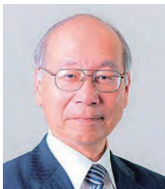
Ерөнхийлөгч Ооно Коотароо

Миний бие 2003 оны 5-р сард тус байгууллагын Тэргүүнээр томилогдон ажиллаж байна. Япон ба Азийн бусад орнууд хоорондын харилцаа нь бүхий л талаар улам нягтаршихын зэрэгцээ харилцан хараат байдал нь улам нэмэгдэж байна. Тус байгууллага нь Хууль зүйн яам, JICA, JETRO болон холбогдох бусад байгууллагуудтай нягт уялдаатай ажиллаж, Азийн орнуудын хуулийн тогтолцоог хөгжүүлэх, маргааныг шийдвэрлэх аргыг тогтворжуулах, хуулийн мэргэжилтэй хүний нөөцийн сургалт, хөгжил зэргийг дэмжих төсөлд хувийн хэвшлийн байр сууринаас цаашид ч идэвхтэй оролцон, хамтран ажиллана гэж бодож байна. Холбогдох хүмүүс та бүхэн бидний үйл ажиллагааны талаар илүү сайн ойлгож, бидэнтэй хамтарч ажиллахыг хүсье.