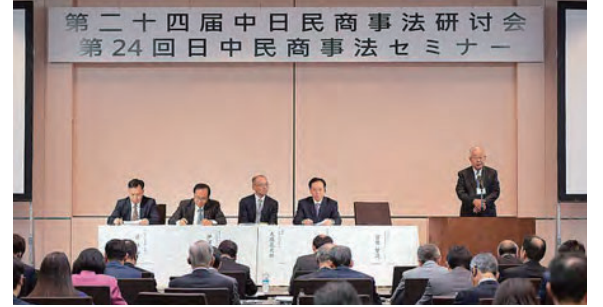
জাপান-চীন সিভিল এবং কমার্শিয়াল ল সেমিনার ২০১৯ সালের নভেম্বর মাসে অনুষ্ঠিত হয় (টোকিও)

বাজার অর্থনৈতিক ব্যবস্থা উন্নয়নের দিকে এগিয়ে যাওয়া চীনের সিভিল এবং কমার্শিয়াল ল এর উপলব্ধিকে আরো গভীরতর করার জন্য, প্রতিবছর পর্যায়ক্রমে জাপান এবং চীনে অব্যাহতভাবে সেমিনারের আয়োজন করা হয়। এই সেমিনার চীনের আইনি ব্যবস্থার সংস্থারের বিরাজমান প্রবণতা সম্পর্কে চীনের বিশেষজ্ঞদের কাছ থেকে তথ্য গ্রহণ করার পাশাপাশি, চীনের অংশগ্রহণকারীগণকে জাপানের আইনি ব্যবস্থা সম্পর্কে জানতে পারার সুযোগ প্রদান করে।